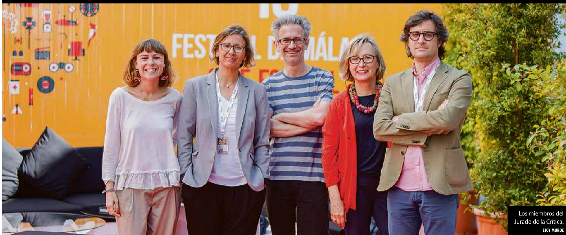
Los miembros del Jurado de la Crítica. ELOY MUÑOZ

"Lo más destacado es la variedad de géneros. Hace una radiografía peculiar de lo que se está produciendo".